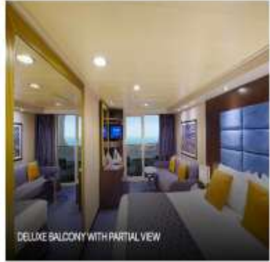
DELUXE BALCONY WITH PARTIAL VIEW