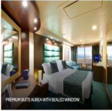
PREMIUM SUITE ALREA WITH SEALED WINDOW