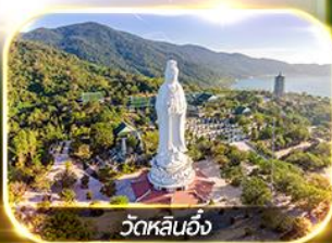
วัดหลินอึ้ง