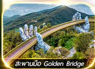
สะพานมือ Golden Bridge