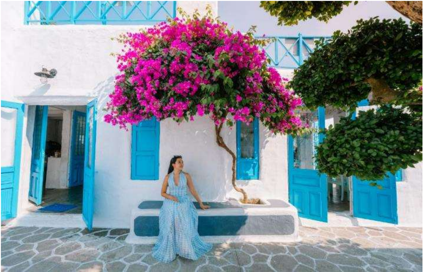
เที่ยง รับประทานอาหารเที่ยง ณ ร้านอาหาร

จากนั้นนำท่าน คาเฟ่ Son Tra Marina Cafe จุดเช็คอินสุดชิลในเวียดนาม คาเฟ่ริมทะเล สไตล์ซานโตรินี่ ในเมืองดานัง อยู่ใกล้วัดหลินอิ่ง (วัดเจ้าแม่กวนอิม) ร้านน่ารักตกแต่งมีสไตล์ดีริมทะเล แต่งร้านโทนขาว ฟ้ามองสบายตา ใครกำลังอยากมีแพลนเที่ยวเวียดนาม ห้ามพลาดคาเฟ่ Son Tra Marina Cafe นี้เลย