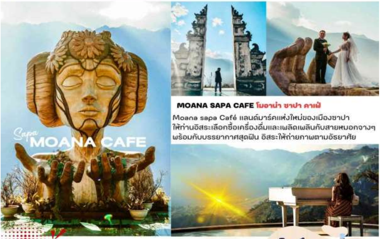
MOANA SAPA CAFE โมอาน่า ซาปา คาเฟ่ Moana sapa Café แลนด์มาร์คแห่งใหม่ของเมืองซาปา ให้ท่านอิสระเลือกซื้อเครื่องดื่มและเพลิดเพลินกับสายหมอกจางๆ พร้อมกับบรรยากาศสุดฟิน อิสระให้ถ่ายภาพตามอัธยาศัย