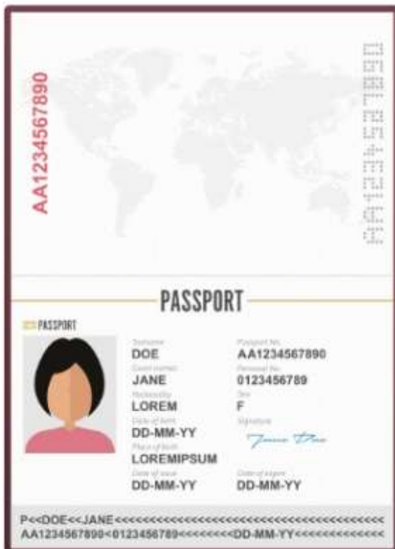
รูปถ่ายหน้าพาสปอร์ต