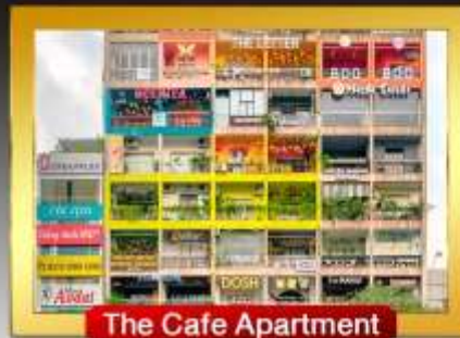
The Cafe Apartment