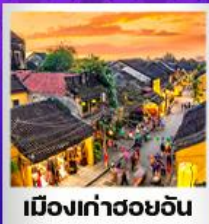
เมืองเก่าฮอยอัน