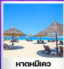
หาดหมีคว