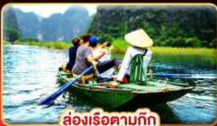
ล่องเรือตามกีก