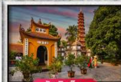
วัดเอนกวิวก