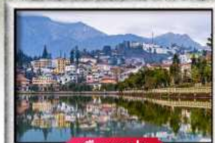
เมืองซาปา