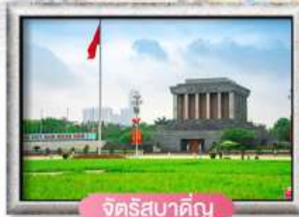
จัตุรัสบาติญ