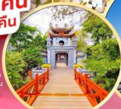
วัดห็อกเซิน