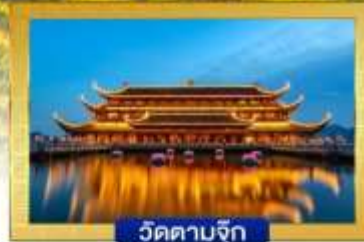
วัดตามจุก