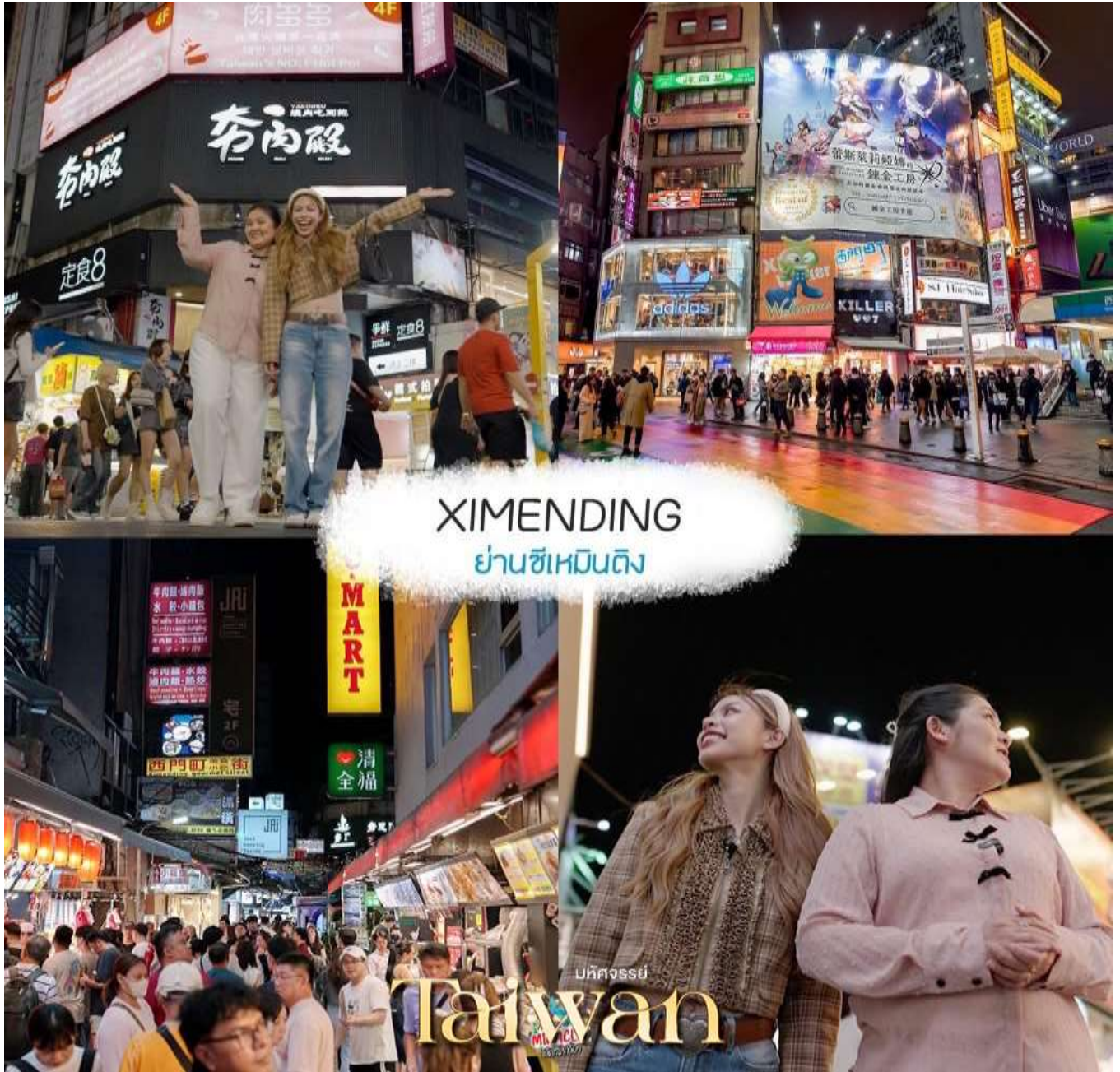
XIMENDING ย่านซีเหมินติง