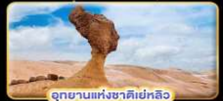
อุทยานแห่งชาติเยลโลว์