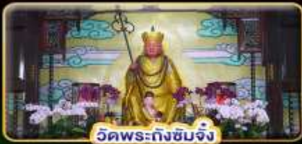
วัดพระถังซำจั๋ง

"ล่องเรือทะเลสาบสุริยันจันทรา" ขอความรักวัดหลงซาน