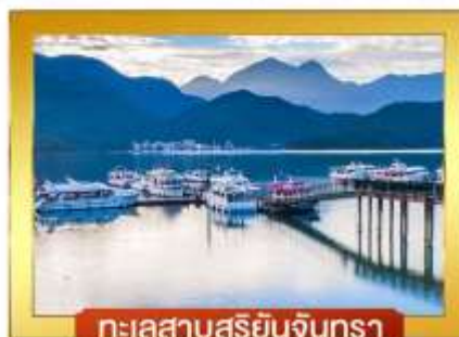
ทะเลสาบสุริยอันจินตรา