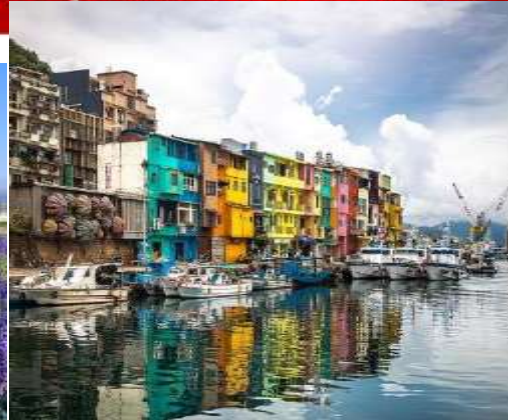
โปรแกรมเดินทาง 5 วัน 3 คืน CHINA AIR