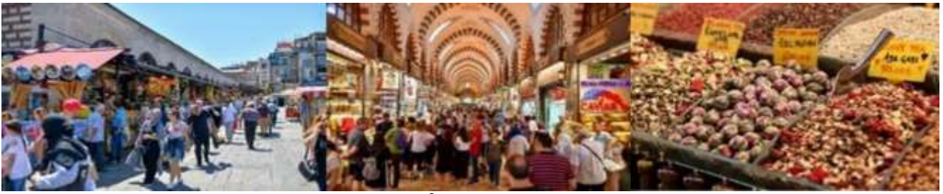
เที่ยง รับประทานอาหารกลางวัน ณ ภัตตาคารอาหารพื้นเมือง