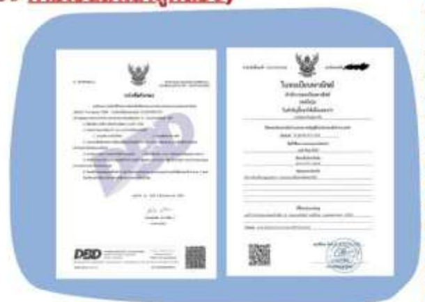
ตัวอย่างหนังสือจดทะเบียนบริษัทฯ และ ใบทะเบียนพาณิชย์