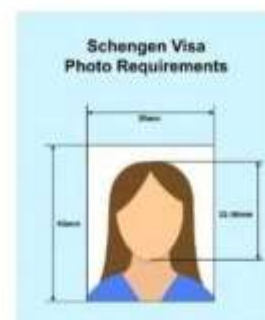
ตัวอย่างรูปถ่าย