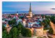
Tallinn Old Town