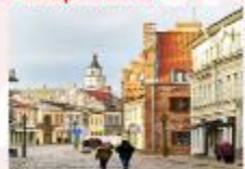
Kaunas Old Town

** พักที่ Holiday Inn Vilnius Hotel 4* หรือเทียบเท่า **