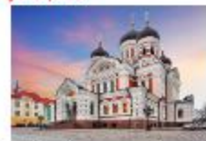
โบสถ์อเล็กซานเดอร์ เนฟสกี

19.35 น. ออกเดินทางสู่อิสตันบูล เที่ยวบิน TK1424