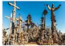
Hill of Crosses