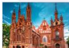
โบสถ์เซนต์แอน