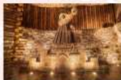
เหมืองเกลือวิลิชก้า