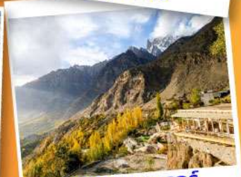
ยอดเขาดูยเกอร์