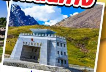
ด่านคุนจิราบ