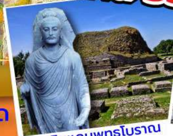
ดินแดนพุทธโบราณ ตักศิลา