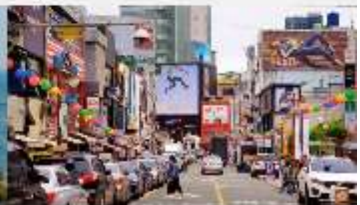
nampodong shopping street

*ทางบริษัทฯ ขอสงวนสิทธิ์ในการสลับโปรแกรมทัวร์ตามความเหมาะสมขึ้นอยู่กับสถานการณ์หน้างาน โดยคำนึงถึงผลประโยชน์ของลูกค้าเป็นสำคัญ