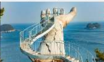
Yeosu Art land