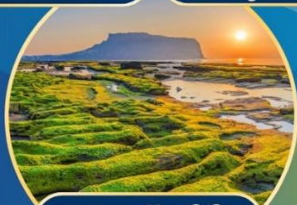
นาตดอซึงซึกี