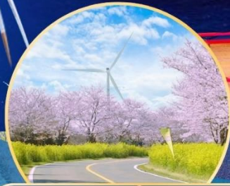
ซากุระ / ทุ่งดอกเรป