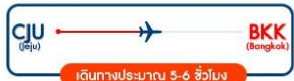
JEJU GOLD PACKAGE NOV 5วัน 3คืน