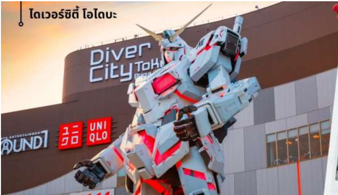
ไทเวอร์ซิตี โอโดบะ

จากนั้นนำท่านสู่ ไทเวอร์ซิตี โอโดบะ Diver City Plaza เป็นเกาะจำลองขนาดใหญ่ ซึ่งสร้างขึ้นจากการถมทะเลบริเวณอ่าวโตเกียว เดิมโตขึ้นอย่างรวดเร็วในฐานะเขตท่าเรือจนถึงช่วงทศวรรษที่ 1990 โอโดบะ ได้กลายเป็นย่านการค้ามี ห้างสรรพสินค้าขนาดใหญ่ที่พักอาศัยและแหล่งบันเทิงที่ใหญ่โตแห่งหนึ่งให้ท่านได้ชม Unicorn Gundam หุ่นกันดั้มตัวใหม่เป็นรุ่น RX-0 Unicorn Gundam ในโหมด Destroy เป็น หุ่นสีขาว-แดงมีความสูงประมาณ 24 เมตร สูงกว่าหุ่นตัวเดิมถึง 6 เมตร และซอปปิงตามอัธยาศัย