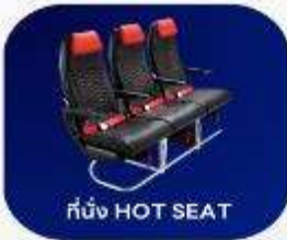
ที่นั่ง HOT SEAT