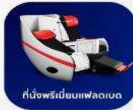
ที่นั่งพรีเมียมแฟลตเบด