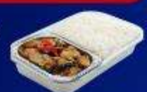
ข้าวกะเพราไก่