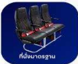
ที่นั่งมาตรฐาน