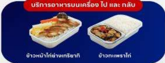
บริการอาหารบนเครื่อง ไป และ กลับ