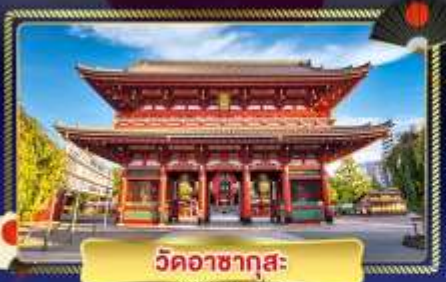
วัดอาซากุสะ