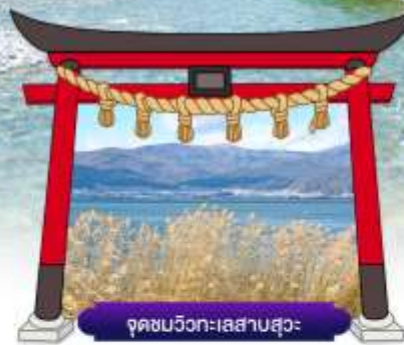
จุดชมวิวกะเลสาบสุวะ