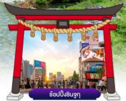
ช้อปปิ้งชินจูกุ