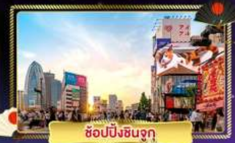
ช้อปปิ้งชินจูกุ