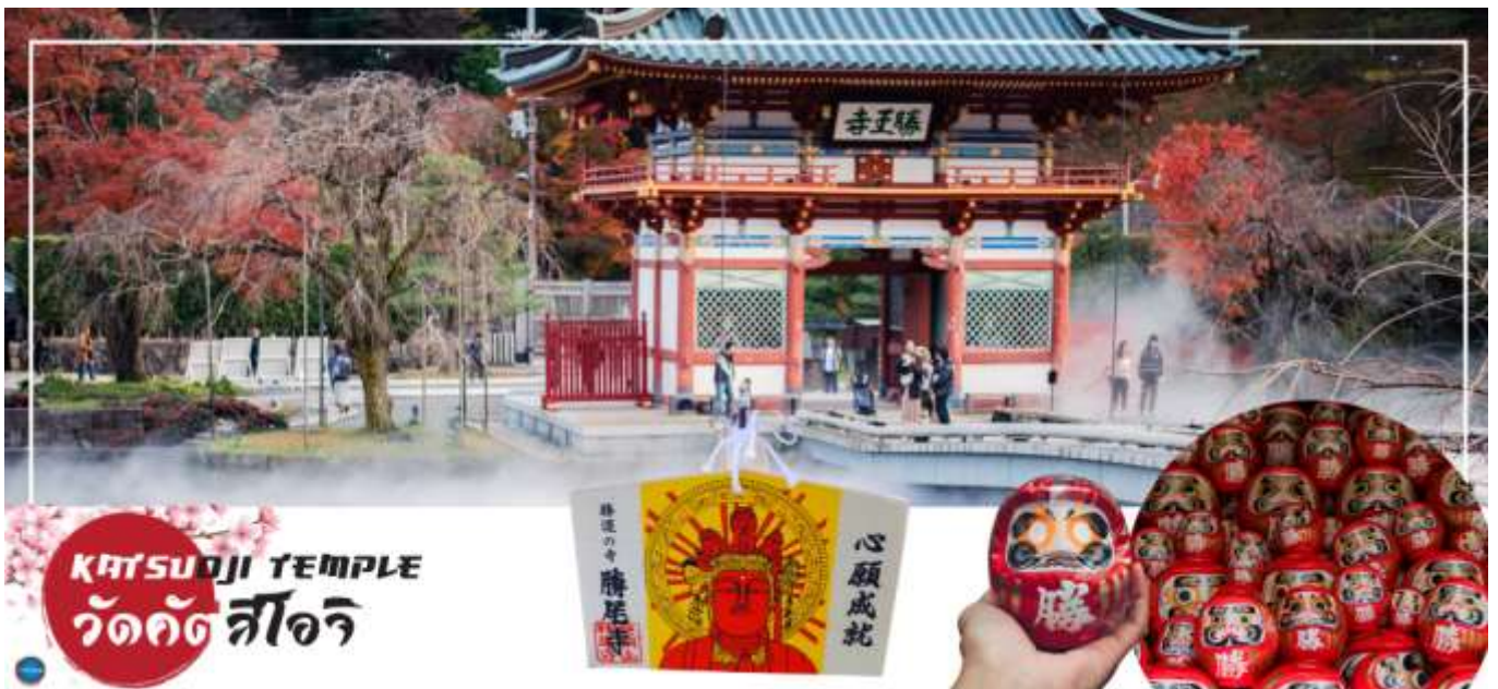
KATSUOJI TEMPLE วัดคัตสึโอะจิ

นำท่านเดินทางสู่ เมืองมิโนะ (Mino) (ใช้เวลาเดินทางประมาณ 1.30 ชั่วโมง) เพื่อนำท่านสู่