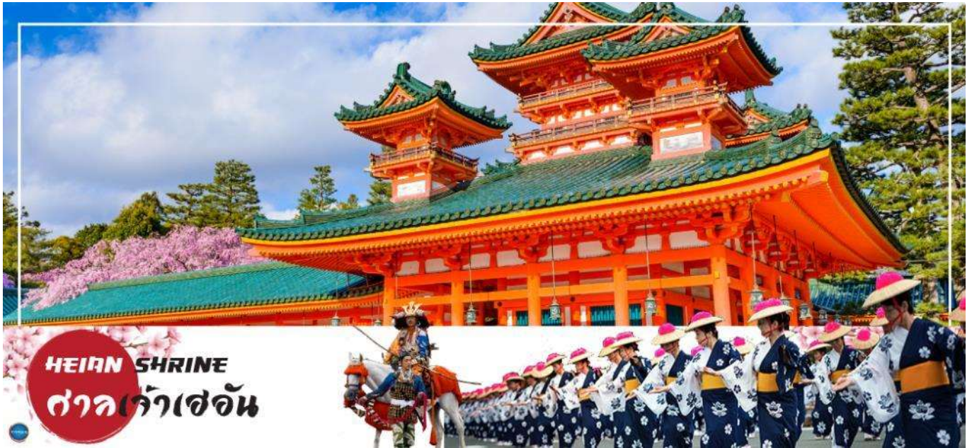
HEIAN SHRINE ศาลเจ้าเฮอัน