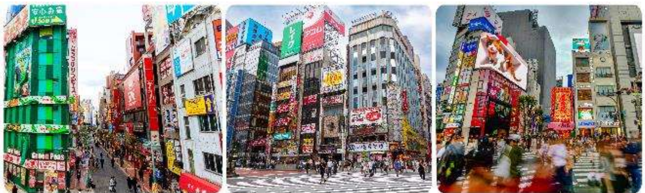
ช้อปปิ้งใจกลางกรุงโตเกียว - ชินจูกุ

มื้อกลางวัน บริการท่านด้วย ชุดอาหารญี่ปุ่นเบนโตะ