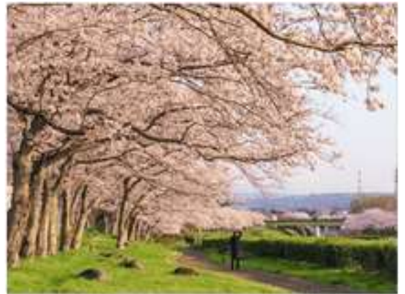
รูปนี้เพื่อประกอบการโฆษณาทัวร์