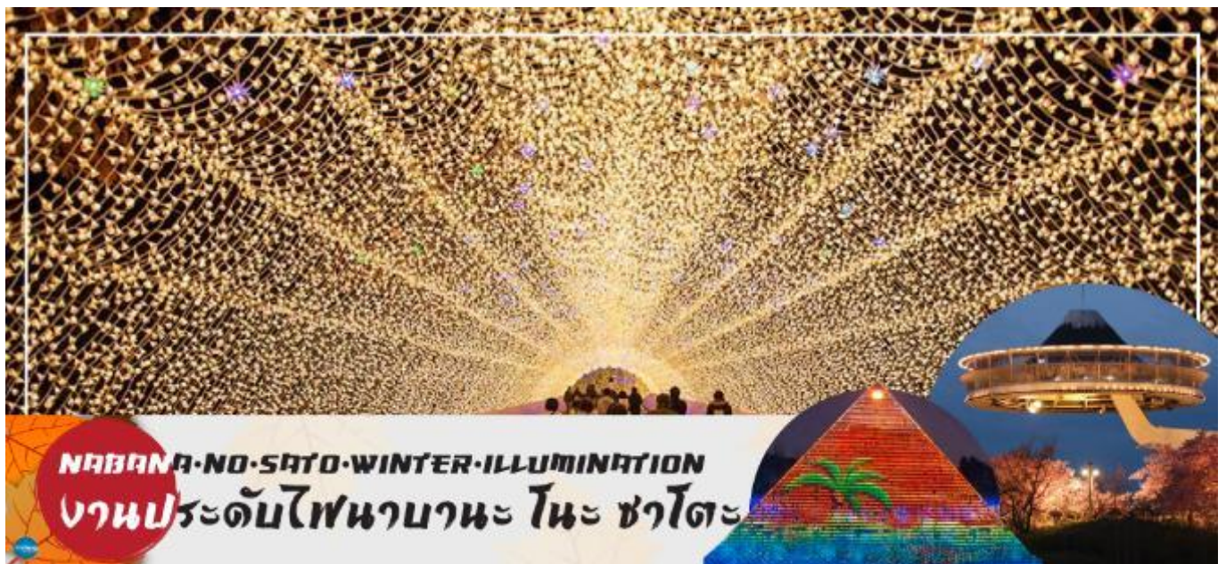
นำท่านชม งานประดับไฟฤดูหนาว ณ หมู่บ้านนาบานะ โนะ ซาโตะ (Nabana no Sato)

นำท่านสู่ เมืองนาโกย่า (Nagoya) (ใช้เวลาเดินทางประมาณ 2 ชั่วโมง) เป็นตัวเมืองของจังหวัดไอจิ มีประชากรอาศัยอยู่มากกว่า 2 ล้านคน เป็นเมืองศูนย์กลางการค้าและการคมนาคมที่สำคัญแห่งหนึ่งของญี่ปุ่น