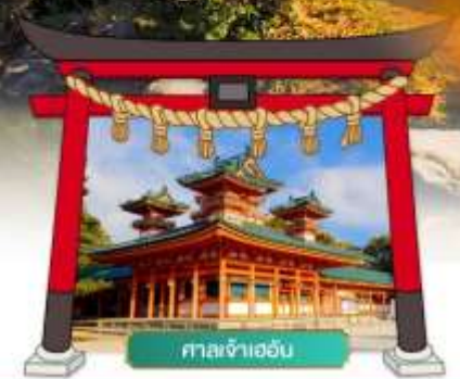
ศาลเจ้าเฮอัน

เดินทางโดยสายการบิน : ไทยแอร์เอเชียเอ็กซ์