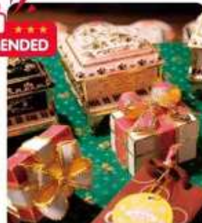
กล่องดนตรี MUSIC BOX