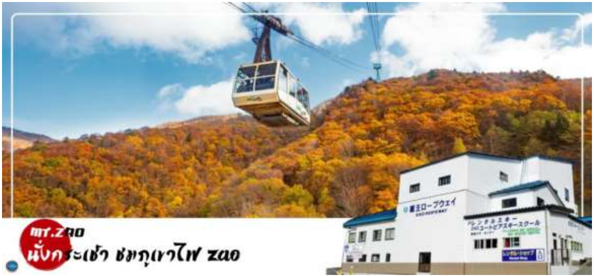
mt. ZAO นั่งกระเช้า ชมภูเขาไฟ zao

วันที่สาม เมืองฟุกุชิมะ – ซาโอะ – ภูเขาไฟซาโอะ (นั่งกระเช้า) – เมืองยามากาตะ – กินชัง ออนเซ็น – เมืองเซนได – ถนนคิลิโรรัด