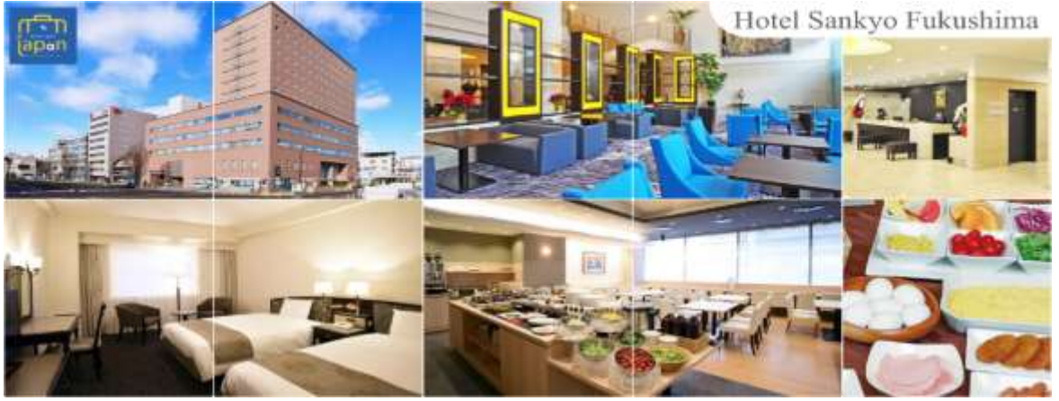
Hotel Sankyo Fukushima

วันที่สาม เมืองฟุกุชิมะ – ซาโอะ – ภูเขาไฟซาโอะ (นั่งกระเช้า) – เมืองยามากาตะ – กินชัง ออนเซ็น – เมืองเซนได – ถนนคิลิโรรัด