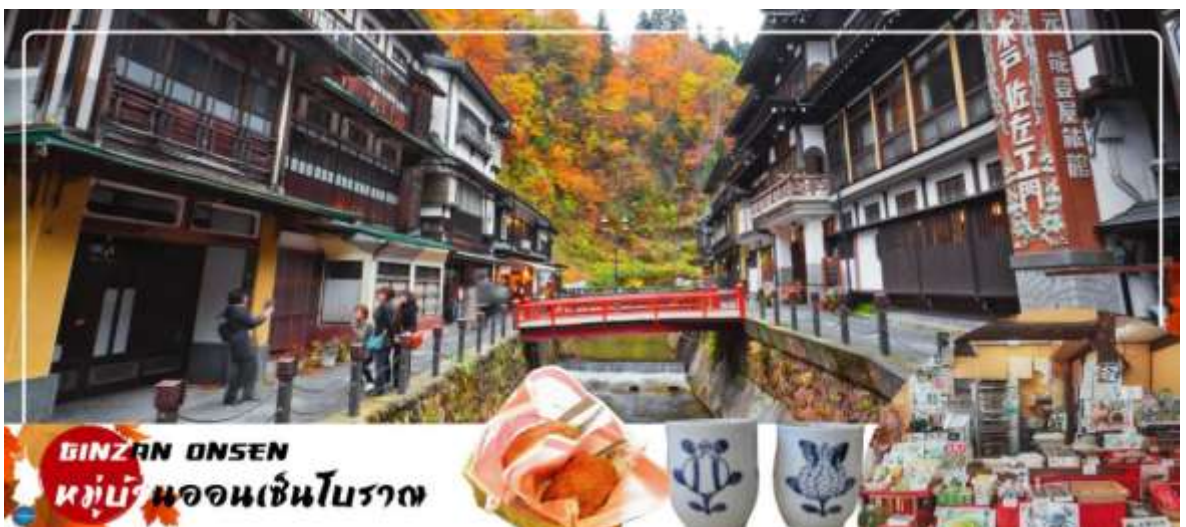
GINZAN ONSEN หมู่บ้านออนเซ็นโบราณ

เช้า รับประทานอาหารเช้า ณ ห้องอาหารของโรงแรม (2) นำท่านชมความงามแปลกตาของฤดูใบไม้เปลี่ยนสี ณ ภูเขาไฟซาโอะ (ZAO VOLCANO) (ใช้เวลาเดินทางประมาณ 1.30 ชั่วโมง) จุดชมใบไม้เปลี่ยนสีที่มีชื่อเสียงของภูมิภาคโทโฮคุ ตลอดเส้นทางท่านจะได้เพลิดเพลินกับธรรมชาติหลากหลายสีสันของป่าเขาในฤดูใบไม้ร่วง จากนั้นนำท่าน ขึ้นกระเช้าไฟฟ้า สูดอากาศให้ท่านได้ชมทัศนียภาพอันสวยงามของฤดูใบไม้เปลี่ยนสีไปยังยอดเขาที่ระดับความสูง 1,736 เมตร ด้านบนประดิษฐานพระพุทธรูปจิโสะองค์ใหญ่ แกะสลักจากหินคาคดผ้าเอี่ยมสีแดงไว้ที่หน้าอกเพื่อเป็นการอุทิศให้กับทหารที่เสียชีวิตจากการทำแท้ง นอกจากนี้ยังมีทะเลสาบบริเวณปากปล่องภูเขาไฟซาโอะคือ ทะเลสาบโอกามะ หรือทะเลสาบห้าสี ซึ่งสีของน้ำจะเปลี่ยนไป