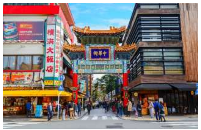
ตั้งอยู่ในเขตเมืองนากาของเมืองโยโกฮาม่า มีอายุ

Highlight! ไปตะลุย ชิมชิลๆ ถ้านึกไม่ออก ขอแนะนำ!! • โอโจ (Ocho) เปิดปอกกิ่งไชลีเล็ก • เอโดะเซ (Edosei) ซาลาเปาลูกโต ขวัญใจคนญี่ปุ่น • โฮเท็นคาคุ (Hotenkaku) เสี่ยวหลงเปาทอด! • หวังฟูจิง (Wangfujing) ก๊ับเสี่ยวหลงเปาทั้งนี้ทั้งทอด • ไคคะโร (Kaikaro) เมนูดั้งเดิมและเมนูสมัยใหม่ • โคโจ (Kocho) ซาลาเปาระดับแชมป์เซียน