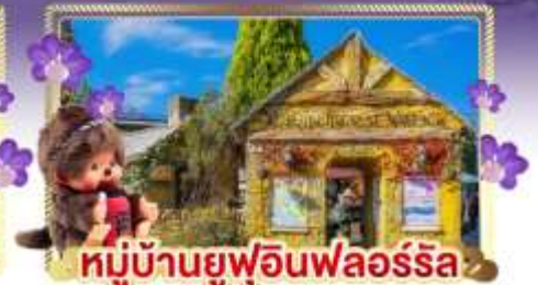
หมู่บ้านยูฟูอินฟลอร์ริล