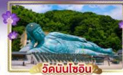
วัดนันโซอิน