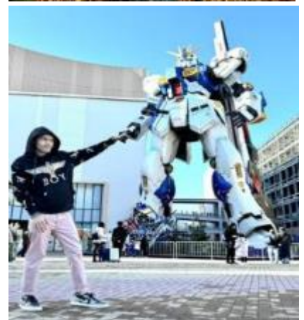
หุ่นกันดั้ม ชื่อ RX93 FF Nu Gundam

เดินทางต่อไปยัง ร้านค้า DUTY FREE ให้ท่านได้ช้อปปิ้งสินค้าปลอดภาษีที่มีคุณภาพ อาทิ เครื่องสำอาง โฟมล้างหน้า(แนะนำ) อาหารเสริม ขนม เครื่องใช้ต่างๆ ฯลฯ ...จากนั้นแวะ แชะรูปกับหุ่นกันดั้มยักษ์ ณ ห้าง LaLaport (หากมีเวลาพอ) มีขนาดใหญ่กว่า Unicorn Gundam ที่โตเกียวและใหญ่กว่า RX93 FF Gundam ที่ Gundam Factory Yokohama เรียกได้ว่าเป็นแลนด์มาร์คสำคัญของเมืองฟูกูโอกะในปัจจุบัน ...จากนั้นอิสระให้ท่านช้อปปิ้ง ย่านเทนจิน (Tenjin) หรือ ย่านฮากาตะ (Hakata) เป็นย่านช้อปปิ้งขนาดใหญ่ใจกลางเมือง รวบรวมแหล่งบันเทิง อย่างครบครัน ไม่ว่าจะเป็นตึกต้นไม้ ร้านค้าที่น่าสนใจ และบรรยากาศสุดคลาสสิก หรือจะเป็นย่านของกินอร่อยๆ อย่างย่านยะไต (Yatai) หมายถึง ชุมชนอาหารที่มีขนาดไม่ใหญ่มาก ที่รวมร้านอาหารแบบฉบับท้องถิ่นเอาไว้มากมาย