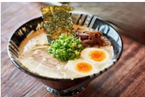
ฮากาตะราเมง (Hakata Ramen)