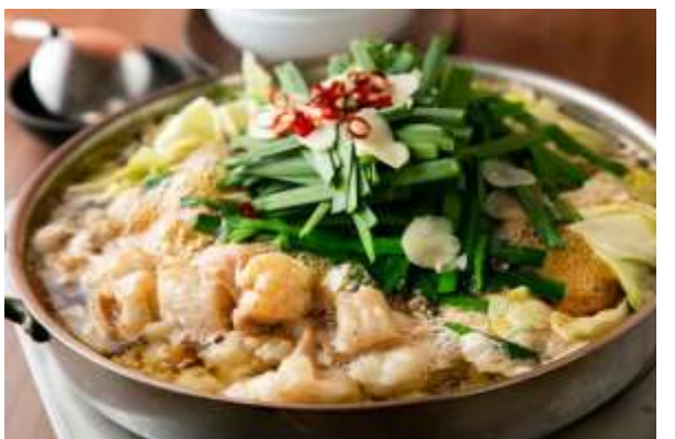
มตสึนาเบะ (Motsunabe)