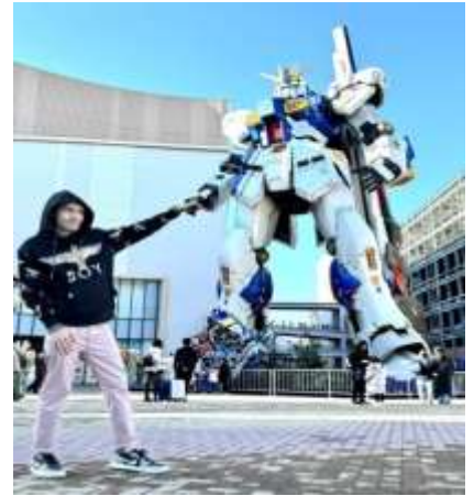
หุ่นกันดั้ม ชื่อ RX93 FF Nu Gundam

เดินทางต่อไปยัง ร้านค้า DUTY FREE ให้ท่านได้ซื้อป๊อปปิ้งสินค้าปลอดภาษีที่มีคุณภาพ อาทิ เครื่องสำอาง โฟมล้างหน้า(แนะนำ) อาหารเสริม ขนม เครื่องใช้ต่างๆ ฯลฯ ...จากนั้นแวะ แซะรูปกับหุ่นกันดั้มยักษ์ ณ ห้าง LaLaport (หากมีเวลาพอ) มีขนาดใหญ่กว่า Unicorn Gundam ที่โตเกียวและใหญ่กว่า RX93 FF Gundam ที่ Gundam Factory Yokohama เรียกได้ว่าเป็นแลนด์มาร์คสำคัญของเมืองฟูกูโอกะในปัจจุบัน ...จากนั้นอิสระให้ท่านซื้อป๊อปปิ้ง ย่านเทนจิน (Tenjin) หรือ ย่านฮากาตะ (Hakata) เป็นย่านช้อปปิ้งขนาดใหญ่ใจกลางเมือง รวบรวมแหล่งบันเทิง อย่างครบครัน ไม่ว่าจะเป็นตึกต้นไม้ ร้านค้าที่น่าสนใจ และบรรยากาศสุดคลาสสิก หรือจะเป็นย่านของกินอร่อยๆ อย่างย่านยะไต (Yatai) หมายถึง ชุมชขายอาหารที่มีขนาดเล็กไม่ใหญ่มาก ที่รวมร้านอาหารแบบฉบับท้องถิ่นเอาไว้มากมาย