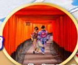
ศาลเจ้าฟุชิมิ อินาริ

เที่ยวเต็มทุกวันไม่มีวันฟรีเดย์ บินเข้านาโกย่า-โอซาก้า