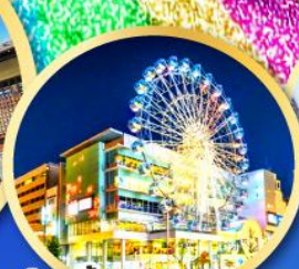
ช้อปปิ้งย่านซากาเอะ