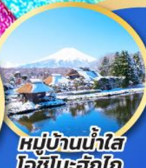
หมู่บ้านน้ำใส โอชิโนะฮักโกะ