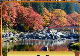
หุบเขาโครังเคะ