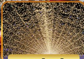
มาบะนะโนะซาโตะ