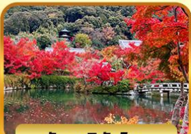
วัดเออิทังโด