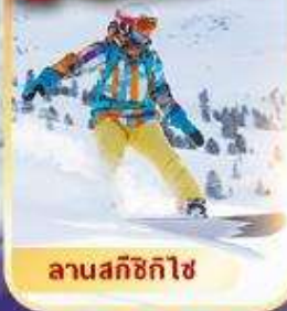
ลานสกีซิกิโงะ