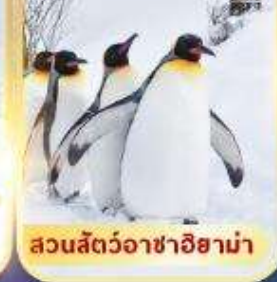
สวนสัตว์อาซาฮิยาม่า