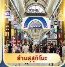
ย่านสุซุกิโนะ