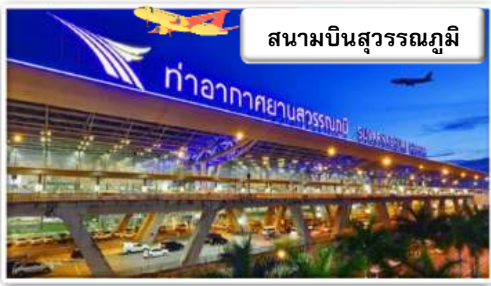
สนามบินสุวรรณภูมิ

เวลา 19.30 น. พร้อมกันที่ ท่าอากาศยานสุวรรณภูมิ อาคารผู้โดยสารขาออกระหว่างประเทศ เคาน์เตอร์ สายการบินไทย เจ้าหน้าที่คอยให้การต้อนรับ ดูแลด้านเอกสาร เช็คอิน และสัมภาระในการเดินทาง