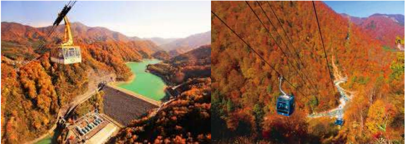
ของบริเวณโดยรอบ

Yuzawa Kogen Ropeway เป็นกระเช้าลอยฟ้าขนาดใหญ่ระดับโลกที่รองรับได้ถึง 166 คน ใช้เวลาเดินทางเพียง 7 นาทีบนเส้นทางราว 1,300 เมตรเชื่อมต่อระหว่างตีนเขากับ Panorama Park ที่อยู่เหนือระดับน้ำทะเลกว่า 1,000 เมตร หน้าสถานีพานoram่าบนยอดเขานั้นเป็นบริเวณที่มีบ่อแช่เท้าและระเบียงกลางแจ้ง ทั้งยังเชื่อมต่ออยู่กับ Kumo no Ue Cafe คาเฟ่ที่สามารถผ่อนคลายไปอย่างสบายๆกลางชมวิวสุดอลังการของที่ราบ Uonuma และเทือกเขา Tanigawa ที่แผ่กว้างอยู่เบื้องหน้า Panorama Park เป็นบริเวณที่มีการแบ่งออกเป็นหลายโซน สามารถเพลิดเพลินไปกับกิจกรรมที่หลากหลาย เช่น การโหนซิปไลน์หรือการเดินป่าพลาชมทิวทัศน์สุดอลังการ