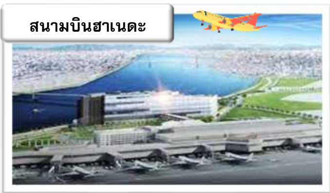
สนามบินฮานอย

22.45 น. ออกเดินทางสู่ สนามบินฮานอย ประเทศญี่ปุ่น โดย สายการบินไทย เที่ยวบินที่ TG 644 06.55 น. เดินทางถึง สนามบินฮานอย ประเทศญี่ปุ่น นำท่านผ่านขั้นตอนการตรวจคนเข้าเมืองและศุลกากร เวลาญี่ปุ่น เร็วกว่าประเทศไทย 2 ชั่วโมง