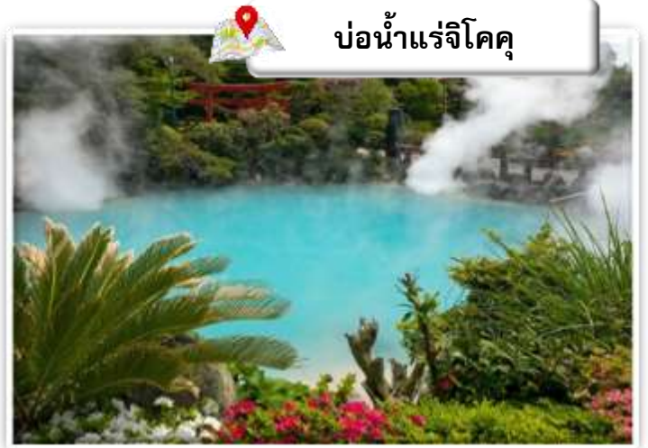
บ่อน้ำแร่จิโคคุ

เดินทางสู่ บ่อน้ำพุร้อน (Jigoku Meguri) หรือ บ่อน้ำพุร้อนขุมนรกทั้งแปด เป็นบ่อน้ำพุร้อนธรรมชาติที่เกิดขึ้นภายหลังจากการระเบิดของภูเขาไฟ ประกอบไปด้วยแร่ธาตุที่เข้มข้น เช่น กำมะถัน แร่เหล็ก โซเดียม คาร์บอเนต เรเดียม เป็นต้น และร้อนเกินกว่าจะลงไปอาบได้ แล้วบ่อทั้ง 8 บ่อ ก็ตั้งชื่อให้แปลกตามลักษณะภายนอกที่เห็นกัน