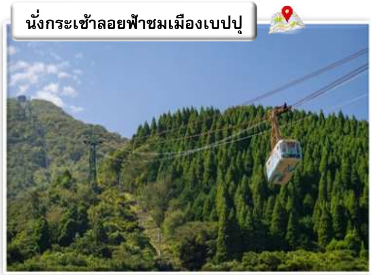
นั่งกระเช้าลอยฟ้าชมเมืองเบปปุ

นำท่านท่องเที่ยวโดย รถไฟสายโรแมนติกยูฟูอินโนโมริ Yufuin No Mori รถไฟสายท่องเที่ยวชื่อดังของภูมิภาคคิวชู ผลงานการออกแบบของอาจารย์เอจิ มิโตะ โอบะ นักออกแบบรถไฟชื่อดังของญี่ปุ่น โดยวิ่งจากสถานีฮาคาตะ (Hakata Station) จังหวัดฟูกูโอกะ (Fukuoka) สิ้นสุดที่สถานีเบปปุ (Beppu Station) จังหวัดโออิตะ (Oita) (บางขบวน) ซึ่งจะผ่านหมู่บ้านชื่อดังอย่าง ยูฟูอิน (Yufuin) จึงเป็นที่มาของชื่อรถไฟที่มีความหมายว่า ผืนป่าของยูฟูอิน ความโด่งดังของรถไฟสายท่องเที่ยวขบวนนี้ จากนั้นนำท่านเดินทางสู่ เมืองเบปปุ