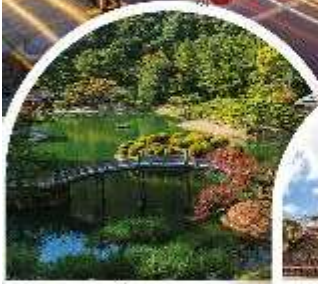
สวนริวกิริน