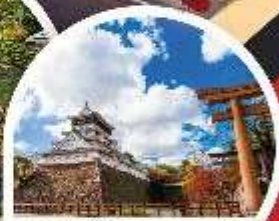
ปราสาทโคคุระ