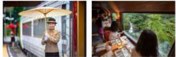
พิเศษ รับประทานอาหารกลางวันบนรถไฟ กับวิวธรรมชาติหลักล้าน

(รูปภายในรถไฟอาจมีการเปลี่ยนแปลง โดยไม่จำเป็นต้องแจ้งให้ทราบล่วงหน้า)