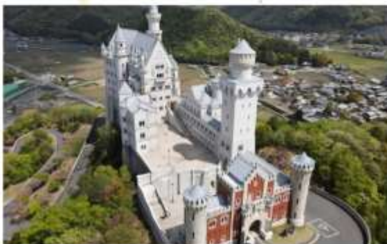
รูปภาพประกอบใช้เพื่อการโฆษณาเท่านั้น