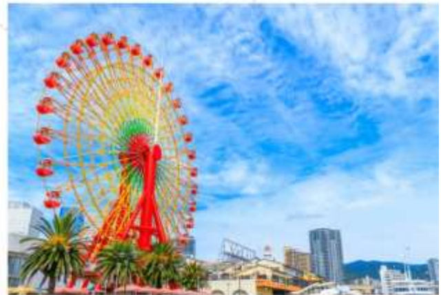
รับประทานอาหารกลางวัน ณ กิตตาคาร

ช้อปปิ้งจุใจย่าน "ชินโซบาชิ" สวรรค์ของนักช้อปปิ้งและนักชิม ใจกลางโอซาก้า ถนนคนเดินยาวกว่า 600 เมตร เต็มไปด้วยร้านค้ากว่า 200 ร้าน มีสินค้าหลากหลายประเภท ตั้งแต่เสื้อผ้าแฟชั่น เครื่องสำอางของฝาก ร้าน 100 เยน ให้ท่านเลือกซื้อของฝากติดไม้ติดมือกลับบ้าน..