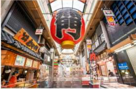
รับประทานอาหารเช้าในโรงแรม