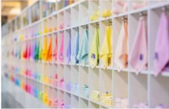
รับประทานอาหารเช้าในโรงแรม