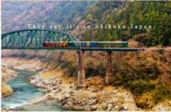
รับประทานอาหารเช้าในโรงแรม

โหม!! ประสบการณ์การเดินทางสุดพิเศษบนรถไฟทู "ชิโกกุ มินนาคะ เซนเน็น โมโนกาตาริ" คัมค่ากับทิวทัศน์อันงดงาม สัมลองอาหารท้องถิ่น และบริการชั้นเลิศเสมือนหลุดเข้าไปในดินแดนแห่งเทพนิยาย