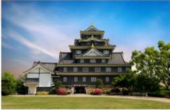
รับประทานอาหารเช้าที่โรงแรม

นำท่านเดินทางชม "สวนโคระคุเอ็น" สวนสวยแห่งโอคายาม่าซึ่งได้รับการยอมรับเป็นสุดยอดสวนสวยของญี่ปุ่นมีทั้งหมด 3 แห่ง ประกอบด้วยสวนโคระคุเอ็น สวนเค็นโระคุเอ็น และสวนโคโนะคุเอ็น และพื้นที่มีขนาดกว้างใหญ่ถือเป็นดวงใจของปราสาทโอคายาม่านี้อีกด้วย