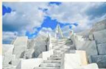
รับประทานอาหารกลางวัน ณ ถัดคาการ