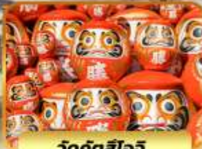
วัดคังดสิโอะจิ