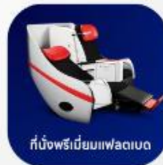
ที่นั่งพรีเมียมแพดเบด