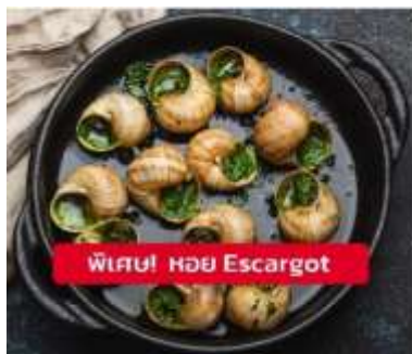
พิเศษ! หอย Escargot

เย็น ๑๑ รับประทานอาหารเย็น (มื้อที่7) เมนูพิเศษ!! หอย Escargot