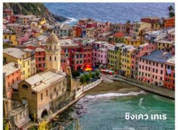
ซิงเคว เทเร

ท่านสามารถทำการสแกน QR CODE นี้ เพื่อรับชม “ซิงเควเทเร” ในรูปแบบวิดีโอ