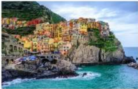
ซิงเคว เทเร

จากนั้นนำท่านเดินทางต่อด้วยรถไฟ สู่หมู่บ้านมรดกโลกและอุทยานแห่งชาติ ซิงเคว เทเร Cinque Terre อ่านว่า ซิงเควเทเร หรือแปลในความหมายตามภาษาอังกฤษก็คือ The Five Land แดนมหัศจรรย์ทั้ง 5 ที่ประกอบกันขึ้นมาเป็นดินแดนแห่งความงดงาม หมู่บ้านเล็กๆ 5 หมู่บ้านที่ซ่อนตัวอยู่ห่างไกลจากสายตาของคนภายนอก แผ่นดินที่ยากจะเข้าถึงได้โดยง่าย หมู่บ้านเล็กๆ 5 หมู่บ้านที่ตั้งเรียงอยู่มีห่างกัน