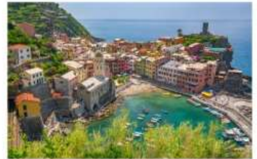
ซิงเคว เทเร

นำคณะเที่ยวชม ซิงเคว เทเร เป็นพื้นที่ที่ UNESCO ประกาศให้เป็นมรดกโลก ด้วยทำเลที่ตั้งของทั้งหมดอยู่บนภูเขาสูง โดมมีหน้าผาสูงชัน และทะเลกว้างใหญ่เป็นฉากหน้า ทำให้มีความสวยงามประดุจดั่งภาพวาด จึงเป็นอุปสรรคสำหรับผู้คนจากภายนอกในการที่จะเข้าไปให้ถึง แต่ในแง่ดีก็คือ หมู่บ้านทั้งห้ายังคงสภาพดั้งเดิมของมันมาได้ตั้งแต่ศตวรรษที่ 11 ประกอบไปด้วย Monterosso al Mare (มอนเตรอสโซ อัล มาเร), Vernazza (เวร์นาซซา), Corniglia (คอร์นีเลีย) , Manarola (มานาโรลา) และ Riomaggiore (ริโอมัจจอร์เร) **ทางบริษัทจะนำทุกท่านเที่ยวอย่างน้อย 1 จากใน 5 หมู่บ้าน**